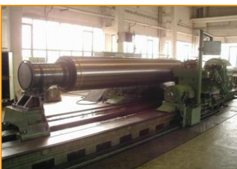
Brúsenie valcov GIUSTINA 10000/ø1650