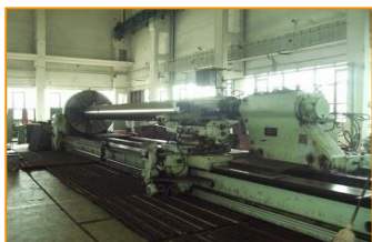
Sústruženie SR2000 10000/ø1600/ø2000