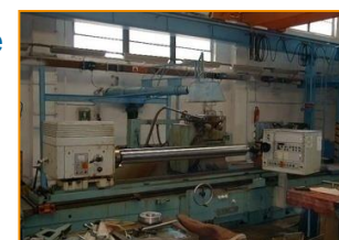
Brúsenie BUC63A/3000 3000/ø630