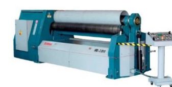
Hydraulická zakružovačka plechu 2500/10 *nové