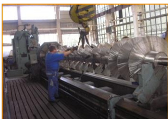
Sústruženie SRM125/7000 10000/ø1010