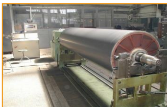
Dynamické vyvažovanie SCHENK 10000/ø2100/7t