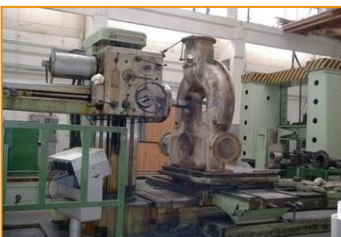
Horizontka W100A 1250/600/1120