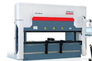
Hydraulický Ohraňovací CNC lis 320t/3050 *nové