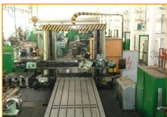
Hoblovka HD125 8000/2000/1960